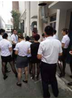
图为公司节能降耗培训现场

次关于工程知识的学习，旨在让大家明白节能降耗、降低成本的重要性。节能降耗不是一朝一夕之事，需要从点滴做起，从点滴做起，从自身岗位做起。要从思想上崇尚节俭，从工作上付诸行动。以节约为荣、铺张浪费为耻，抛弃“人大大业大，浪费点儿没啥”的理念，要在各个工作岗位上精益求精，作为一个有责任心、荣誉感和使命感的浅深人，从节约一滴水、一度电、一方气做起，持之以恒，为企业的持续、健康发展共同努力。