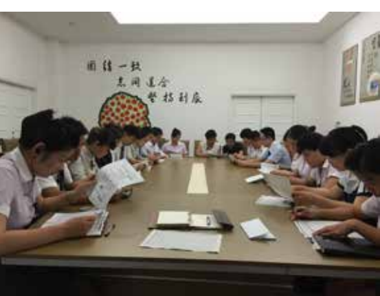
图为公司财务部物耗定量会议现场

(本报讯/刘维)公司的节能降耗，需要树立既传统又富有时代气息的节约文化。需要各管理人员的重视和参与，还需要财务部的物资定量。2015年8月15日下午17时，在京汉分公司会议室举办了财务部物耗定量会议，各管理人员均参加了此次专题会议。